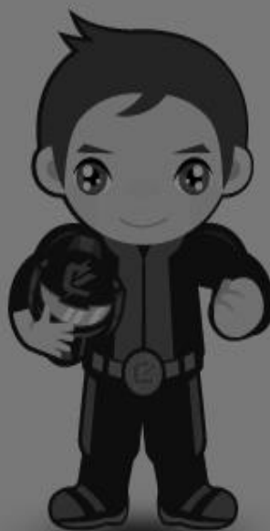
高中職五專學生組